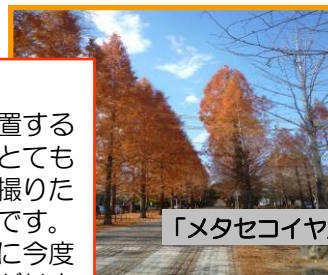
「メタセコイヤ並木」

学びの森の南に位置するイチョウ並木です。とても素敵で思わず写真が撮りたくなってしまいます。紅葉が終わった頃に今度はイルミネーションが付きこちらも必見です。