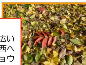
「色とりどりの落ち葉」

東海中央病院南側の広い通り。東島池辺りから西へ6kmも続きます。イチョウの木も大きくなり黄色い葉が風に舞う様に思わず見とれてしまいます。