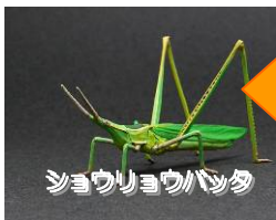
ショウリョウバッタ

どうですか?バッタと遊びたくなくなってきましたか?ラ・ルーラの外の草むらでもすぐに見つかります。一緒に虫取りに行きましょう!