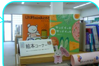
各務原キャンパス図書館にて

どちらの絵本もホットケーキやサンドイッチを作る様子を描いている絵本です。おいそな食べ物次々と登場し、次のページを開くのが待ち遠しくてならないおいしくて楽しい絵本です。