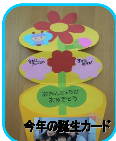
今年の誕生カード

毎月の誕生会のプレゼントカードは今年も保育士の手作りです。今年はお花の誕生カードです。その日の親子写真を撮ってカードに貼って仕上げます。そして今年もうひとつ。ママやパパへのプレゼントカードもあります。こちらも保育士手作りの季節のカードです。季節感が感じられるようなポップアップカードでご自宅のリビングなどに飾っていただけたらと思っています。誕生月には是非お申し込みください。