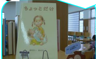
各務原キャンパス図書館にて