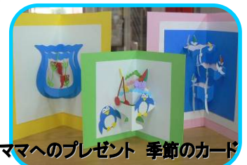
ママへのプレゼント 季節のカード