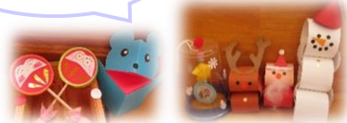
催しのプレゼントも年齢を考えた作品を