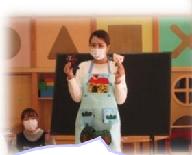
エプロンシアターやペーパーサート作品も新作です