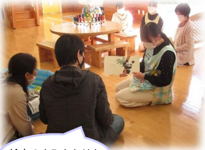
絵本のみきかせも今年度は少人数で