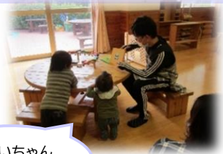
「おにいちゃん(絵本)読んで!」

10月から1月まで約4か月間20人の学生(教育学部3年)が「地域子育て支援実習」にてお世話になりました。地域における子育ての現状理解を深めるために例年は地域の子育て支援センターや児童館などで実習を行っています。しかし今年はコロナ禍で学外実習を断念し、ラ・ルーラで実習を行いました。幼稚園保育園等や施設等での実習は重ねてきていますが、保護者の方とコミュニケーションを取らせていただくこの実習は学生たちのチャレンジの一つでした。朝一番の挨拶さえも緊張していた学生たちでしたが、皆さんに温かく受け入れてもらい少しずつ力をつけて行くことが出来ました。本当にお世話になり、ありがとうございました。またよろしく願いいたします。