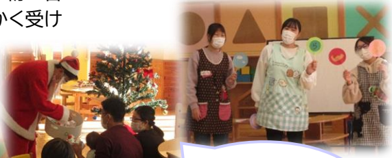
クリスマス会・お楽しみ会の企画やプログラム内容も全て自分たちで考えて