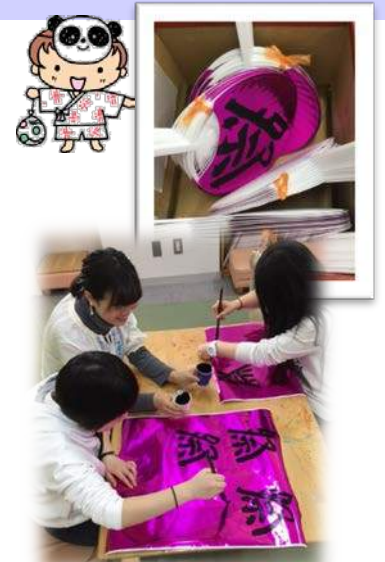
スタンプラリー用 手作りうちわ