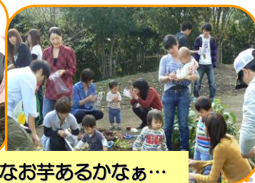
大きなお芋あるかなあ…