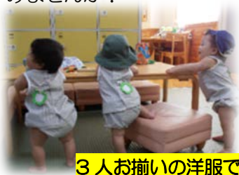
3人お揃いの洋服で

夏の頃の「帽子作り」から発展してお友達同士でお揃いの洋服を作り3人揃ってその洋服を着て遊びに来てくださった時は注目の的でした。また先月は、色画用紙を使ってB6サイズの形に仕上げた冊子を基本に「絵本作り」をしました。するとママの愛情とアイデアがいっぱい詰まった力作がどんどん仕上がり「うぁ～ステキ!」「可愛いね」と知らないうちに会話も広がりました。作品を作っている時の充実感とみんなと見せ合っただけの楽しさを共有する喜びが作品作りの魅力のようです。あなたも作ってみませんか?