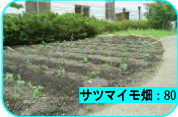
サツマイモ畑：80本の苗を植えました！

夏が終わり秋になったら今度は「サツマイモ堀り」を楽しみます。大きなお芋が出来るでしょうか。どうぞお楽しみに！