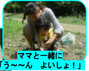
ママと一緒に 「う〜ん よいしょ！」