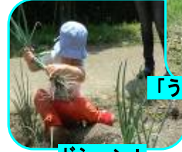
ドシーン！ 「ハハハ あいたたた〜」