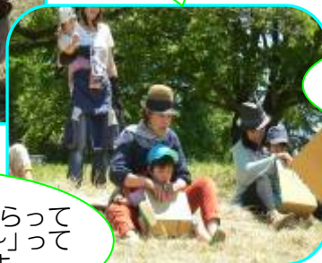
ママに引っ張ってもらって草すべり! 「シュウ〜」ってすべって楽しかったよ。