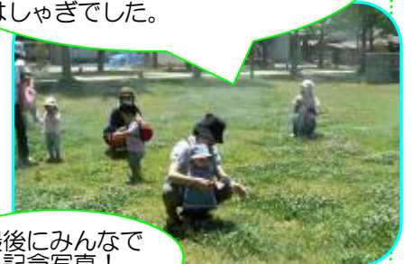
最後にみんなで記念写真!