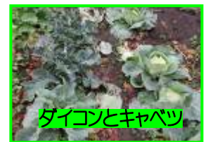
ダイコンとキャベツ