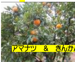
アマナツ & きんかん