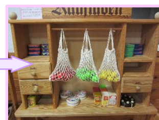
小さいサイズの野菜はネットの中に