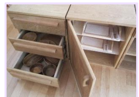
器やまな板・包丁は引き出しに

ままごとコーナーに遊具が増えました。今まであった木製野菜遊具に加え新たに、半分に切れる野菜(7種類)がカゴに入って仲間入りしました。また、今までより小さいサイズの野菜も仲間入りし、こちらはネットに入っています。器やまな板・包丁類は引き出しの中へ移動し、棚には新しいチーズや缶ケースも置きました。どんな遊びが広がるでしょう。楽しみです。