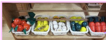
半分に切れる野菜はカゴの中に

遊具が増えた分、片付けも大変になります。でも「お片づけも遊びのひとつ」と考え、遊びが変わるタイミングを見逃さずお子さんと一緒にゲーム感覚で楽しむと上手く出来るようになります。