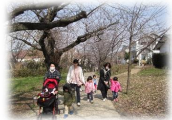
昨年度の冬の散歩の様子