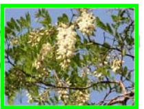
ニセアカシヤの花