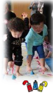
絵の具遊びも楽しかったね！