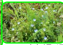
オオイヌノフグリ