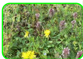
ヒメオドリコソウ

この時期は、ナズナをはじめ、オオイヌノフグリ・ハコベ・ホトケノザ・ヒメオドリコソウ等色々な植物が可愛い花を咲かせています。よく「子どもの目線で」と言いますが、それは感覚や感情だけではなく物理的に子どもの目線は大人よりずっと低く、手も大人よりずっと地面に近いわけで、そんな目線で周りを見ると気づきや発見も多くなるのではと単純に思います。ちょっとだけ周りの草木を気にして見てください。いろいろな楽しいものがきっと見えてきますよ。