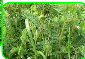
カラスノエンドウ