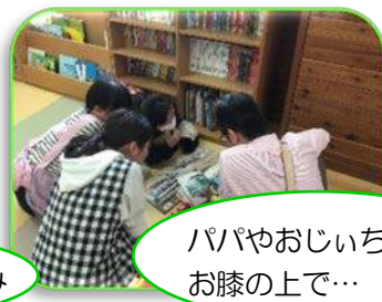
パパやおじいちゃんのお膝の上で…