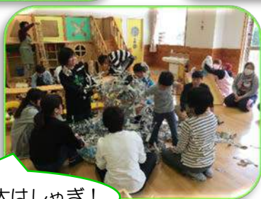
新聞プールで大はしゃぎ!