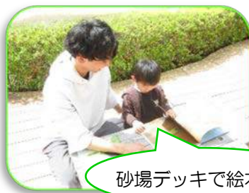
砂場デッキで絵本読み