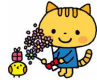
「ランチタイムコンサート」