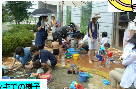
昨年度の砂場デッキでの様子