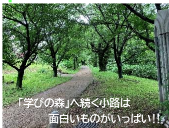
「学びの森」へ続く小路は面白いものがいっぱい!!

空模様を見ながら「小雨になったなあ」「止んだな」と思ったら長靴をはいて戸外へ。雨上がり人通りも少なくのびのびと歩けます。空気も澄んで気分転換には最高です。葉っぱの上のしずくを見たり触ってみたり、水たまりに小石を投げたり葉っぱを浮かべたり…いつもと違う遊びに出会えます。長靴を履いていれば水たまりも楽しい遊場となります。